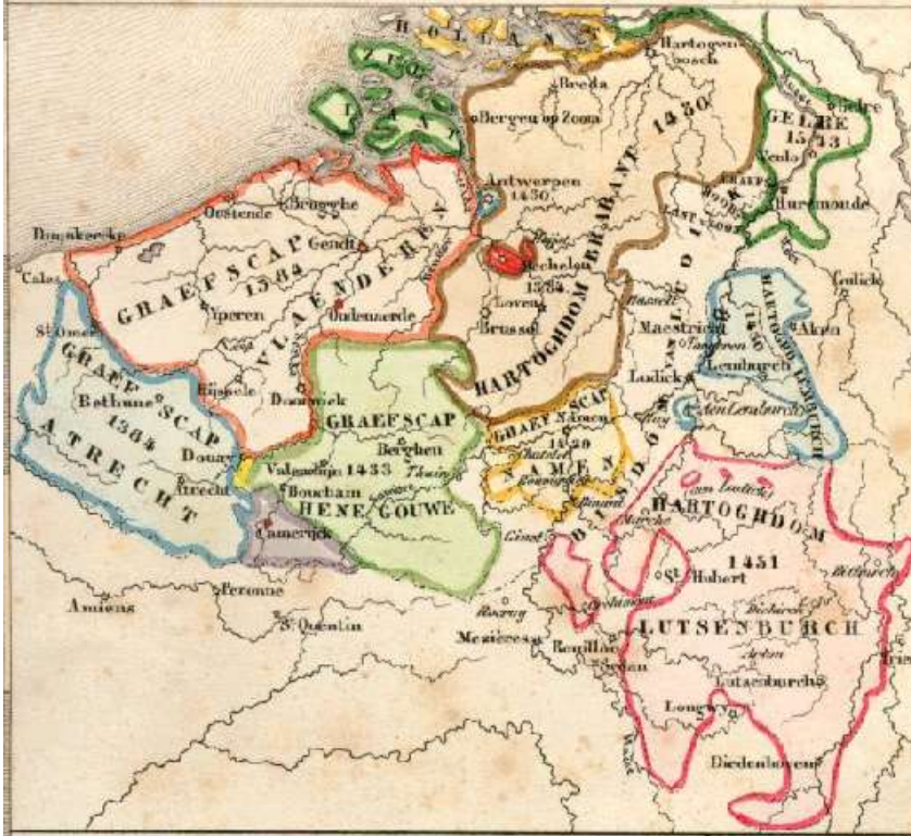
(De Zuidelijke Nederlanden bij het begin van het Bourgondische tijdperk)